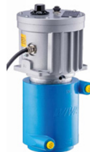
Vielseitiges Zubehör von Zulauftrichtern bis Materialerhitzer