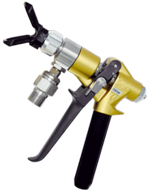
Wiwa 500 F