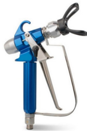
H +S 700