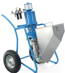
Ausführung für Brandschutzmaterial