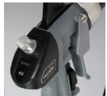
Bei der Cascade Pistole gehört das Einstellen des Spritzbildes an der Pistole und das Einstellen der Spannung mit drei Einstellwerten zur Grundausstattung.

Die beleuchtete LED-Anzeige am Steuergerät ermöglicht eine gute Ablesbarkeit.